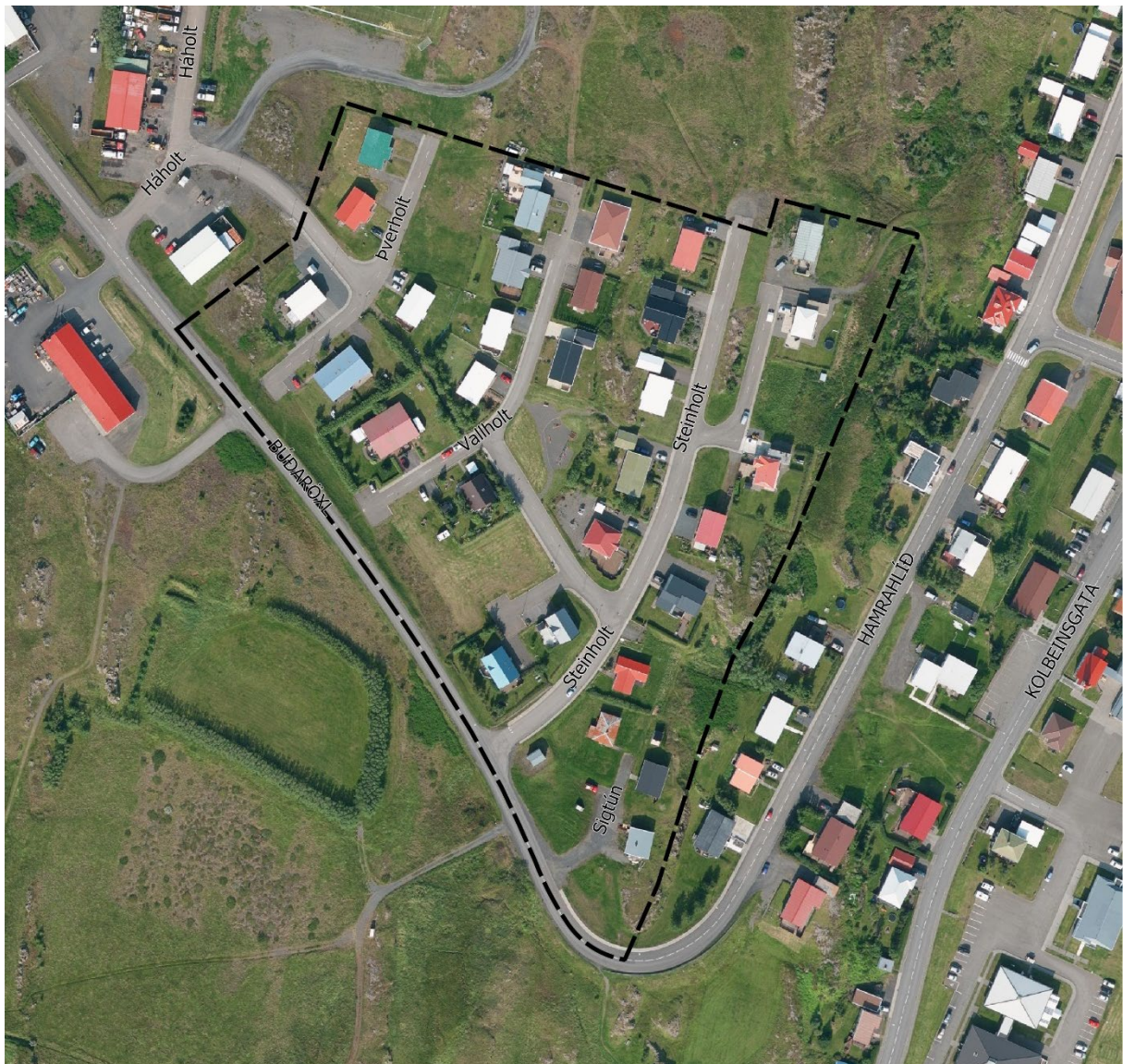
Mynd 2.1 Loftmynd af Holtahverfi ásamt afmörkun deiliskipulags.

Á mynd 2.1 má sjá skipulagsmörk Holtahverfis en skipulagssvæðið er um 4,4 ha. Íbúðagöturnar Þverholt, Vallholt, Steinholt og Sigtún eru innan skipulagssvæðisins.