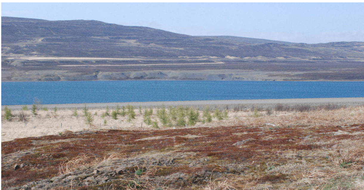
Mynd 1 Horft yfir eldra urðunarsvæðið þar sem trjám hefur verið plantað og í bakgrunni sést Skógalón.

66 kV loftlína liggur í gegnum svæðið með 25 m helgunarsvæði. Einnig er 11 kV jarðstrengur plægður í jörðu.